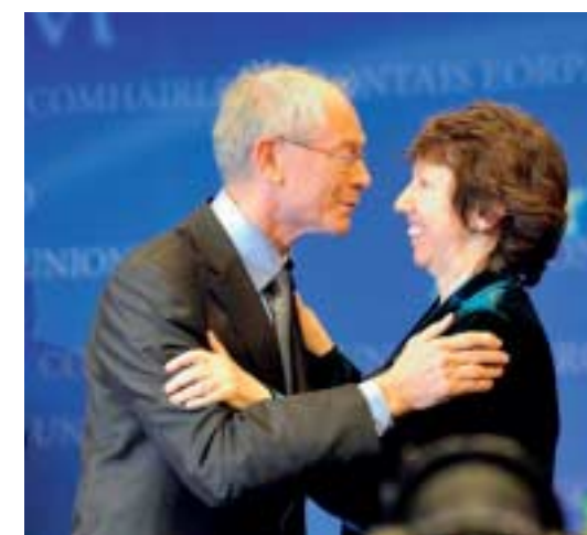
Formanden for Det Europæiske Råd, Herman van Rompuy, og EU's udenrigsrepræsentant, Cathrine Ashton

stats- og regeringschefer med formanden for Europa-Kommissionen og forhandler om de overordnede EU-målsætninger. Møderne ledes af Herman van Rompuy, som i slutningen af 2009 blev udnævnt til formand for Det Europæiske Råd. Med Lissabon-traktaten blev det også besluttet at have en fast udenrigsrepræsentant som udover at være næstformand i Kommissionen også skal lede møderne i ministerrådet, når medlemslandenes udenrigsministre mødes. I øjeblikket er baronesse Cathrine Ashton EU's udenrigsrepræsentant.