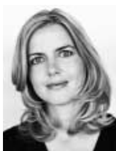
Ellen Trane Nørby Næstformand